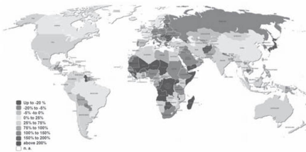
Figura n.º 1 – Projeções de crescimento da população mundial, 2010-2050

Os fenómenos migratórios não são apenas fenómenos sociais, mas também fenómenos demográficos, com impactos nas dinâmicas de crescimento populacional. A população mundial atingiu em 2011 os 7 bilhões de habitantes e tem vindo a crescer, desde o início do século XX, a uma média de 77 milhões de pessoas por ano (cerca de 1,1%). O maior crescimento populacional ocorre no Sul da Ásia, Médio Oriente e África subsaariana. Apesar disso, assistimos a um desaceleração no crescimento populacional, pelo que se projeta que após atingir os 10 mil milhões de habitantes, “the global population will start declining toward the end of the 21 st century or at the beginning of the 22 nd ” 22 (Figura n.º 1).