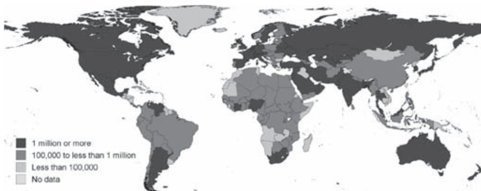
Figura n.º 2 – Migrantes Internacionais 2013

O atual mapa das migrações europeias (Figura n.º 2) é caracterizado por diferentes motivações e modalidades, que explicam a existência de distintos perfis migratórios. Só recentemente os países da Europa do Sul se tornaram países atrativos para as migrações internacionais, parcialmente devido ao seu desenvolvimento económico após a entrada no projeto europeu. Portugal pertence a este grupo de países, juntamente com Espanha, Itália e Grécia.